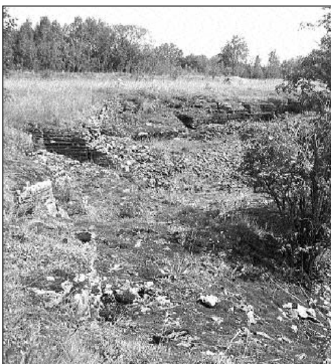
Peeter Suure merekindluse kaevikud.

Kui meie vallas on toimumas mõni sündmus või tähtpäev, on võimalik väljapanekut ka seal eksponeerida, kuna seda on lihtne paigaldada. Stendi saamiseks tuleb võtta ühendust projektijuhiga. Slaidiprogrammi esitleti Valimisliidule