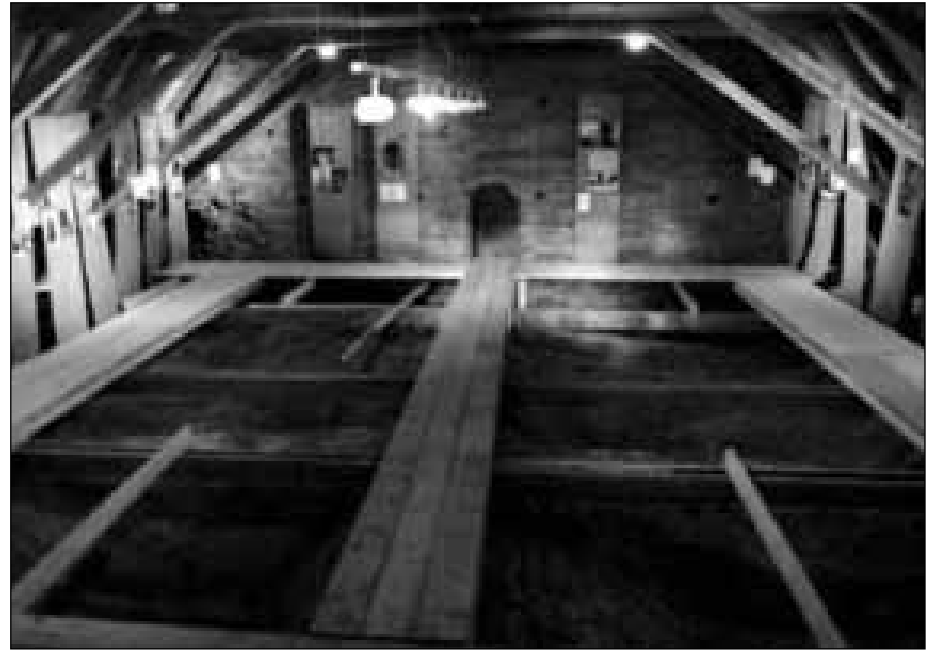
Kihelkonnapäeval avati pühakoja võlvidel näitus Harjumaa kirikutest. Need, kes võlvidele jõudsid, avastasid ühe uue ja huvitava näitusepaiga Peeter Säre heade fotodega, lisaks Silja Kõnsa seletavad tekstid.