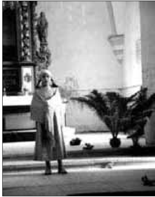
Paljude jaoks pisut harjumatus kohas – kirikus – jutustati KATEatri esituses Harala elulugusid, kus oli nii ironiat kui ka traagikat. Elu ja surma teemat muutis mõjusamaks just valitud koht.