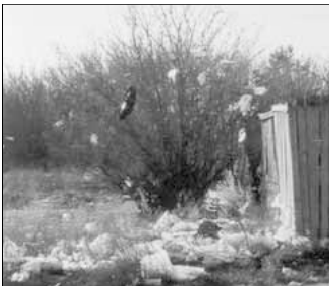
Kilekottidega "ehitud" põõsas endise Kuusalu prügilal kõrval.