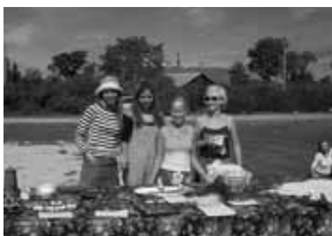
Laadapäev võis alata.

omanikuks sai Saigu talu majapidamine. Sellest ettevõtmisest võib eelkõige Neeme küla.