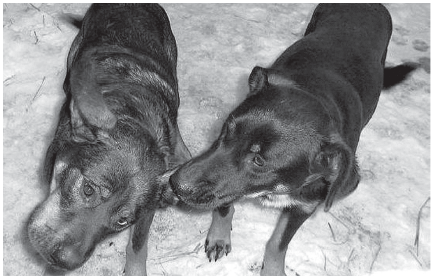
Alates 2. jaanuarist ootavad oma peremeest või uut kodu kaks emast segaverelist õuekoera, kes on püütud Jõelähtme golfiväljakult.

Kui siiski on juhtunud, et loom mingil viisil kodust lahkub, on loomaomanikule igati kasulik, et koer ja kass oleks märgistatud ja kiiresti üles leitav . Selleks on kaks võimalust: looma kaelale olev