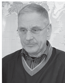
Enn Tupp, Eesti Vabariigi kaitseatašee Taanis ja Norras, endine kaitseminister

Tegelikult nõustun juba ajakirjanduses kõlanud väitega, et teenetemärgi peaks saama kogu Eesti rahvas. Praegu kehtib põhimõte, et aumärke antakse hääletustulemuse järgi. Et see, kes hääletas aastal 1991 Eesti iseseisvuse poolt, see saab aumärgi. Paljud nagu minagi, saavad selle teistkordset sama asja eest. Märk on vaid veidi erineva nimega.