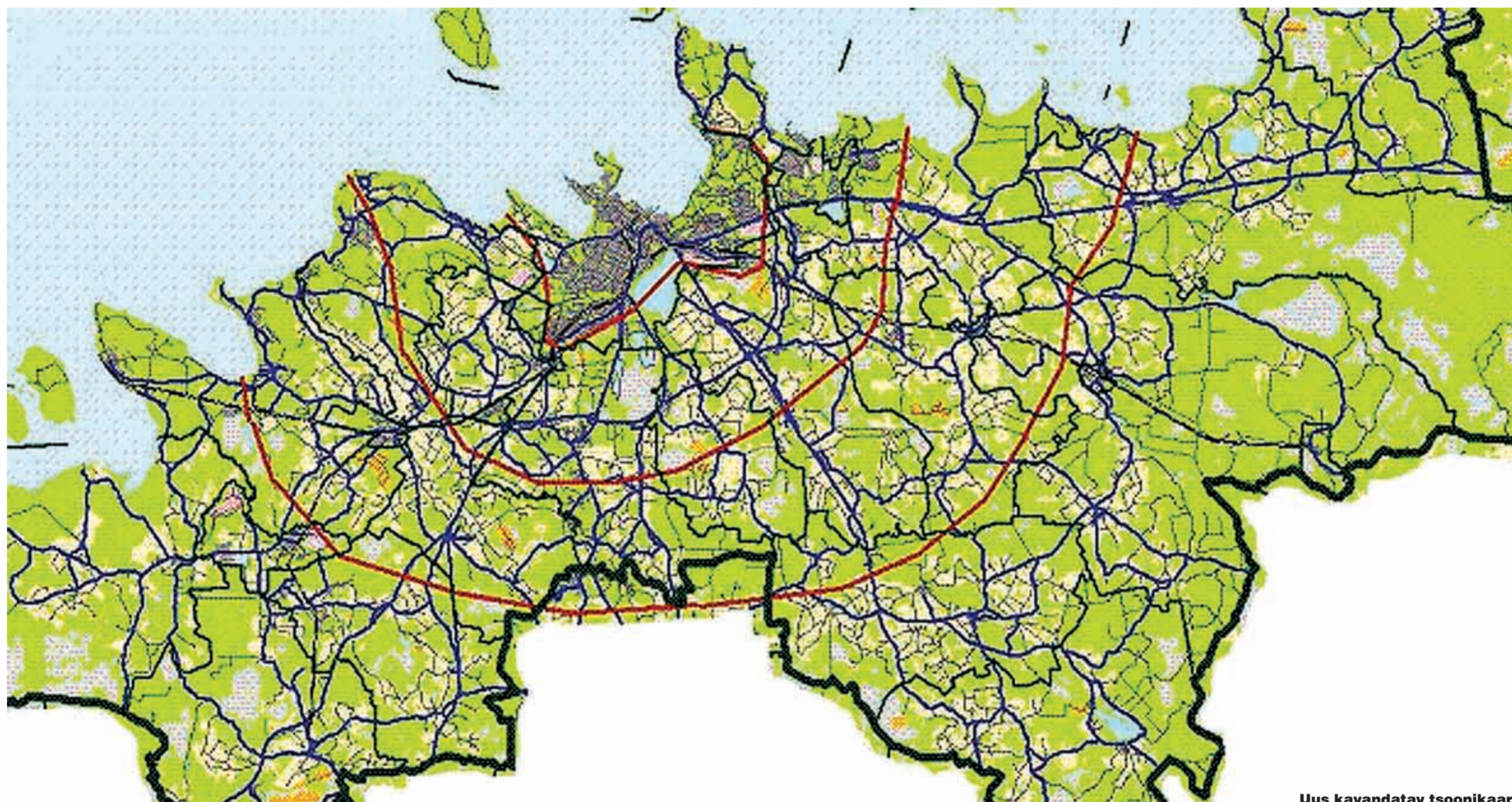
Uus kavandatav tsoonikaart

Täna on seis selline, et suured bussid sõidavad läbi kõik väikesed külad ja liini lõpukilomeetritel istub bussis vaid mõni üksik reisiija. Uue plaani kohaselt jäävad suured bussid sõitma vaid põhiliinidel suuremate tõmbekeskusteni. Jõelähtme vallas on sellisteks punktideks planeeritud Loo alevik, Kostivere alevik ja Jõelähtme küla. Põhiliinid sõidaksid seega Peterburi mnt., Vana-Narva mnt. ja Piibe mnt. pidi. Nii saab garanteeritud suurte busside täituvus ja ka teenindamise kiirus peaks oluliselt tõusma.