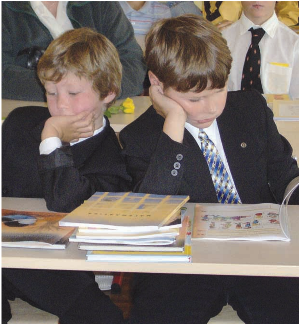
Kostivere Põhikooli 1. klassi õpilased tutvumas uute töövihikutega

Jõelähtme Vallavalitsuse sotsiaalosakond