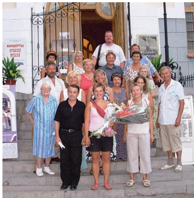
Koor koos sõpradega