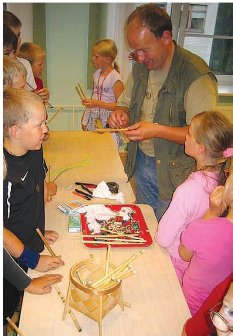
Pilliroost vilepille meisterdamas

Loo linnalaager toimus 21. augustist 25. augustini. Sellest võttis osa paarkümmend meie valla last, eeskätt muidugi Loo lapsed. Igaks päevaks oli välja mõeldud kindel teema, mis tegi laagripäevad huvitavaks ja vaheldusrikkaks.