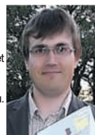
ANDRUS UMBOJA Vallavanem