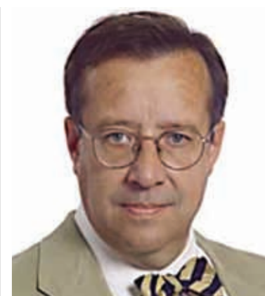
23. septembril 2006.a. otsustas valijameeste kogu, et Eesti Vabariigi 4. presidendiks saab Toomas Hendrik Ilves