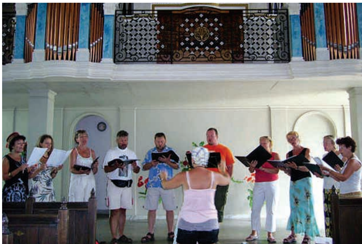
Loo Kammerkoori proov Livadia orelisaalis