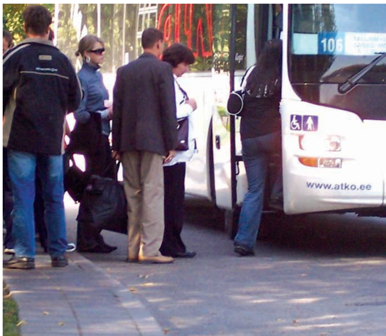
Loo aleviku inimesed sisenevad Tallinna busi

Toitvatel (väiksema sõitjate arvuga, kohalikel- toim.) liinidel sõidavad juba väiksemad bussid ja nende suundade kasumlikkus seetõttu kindlasti tõuseb. Toitvate liinide sagedus pannakse paika vastavalt vajadusele ja võimalik, et vajaduse korral kasutatakse ka siin suuremaid busse. Selline ümberistumise süsteem on küll kliendile ebamugavam, kuid kokkuhoitud raha arvelt saame paremini teenindada põhiliine. Oluline on, et loodav süsteem oleks võimalikult paindlik, reisirajasõbralik.