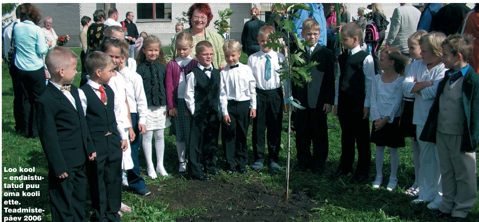
Loo kool – endaistutatud puu oma kooli ette. Teadmiste-päev 2006