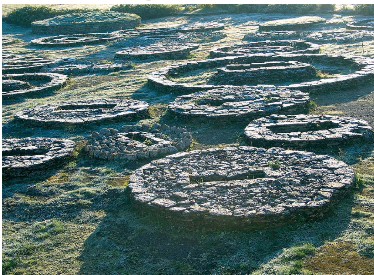
Eesti vanimad ja esinduslikemad kivikirstkalmed

Riigil Muinsuskaitseameti näol on jätkuv huvi säilitada kaitseala või-