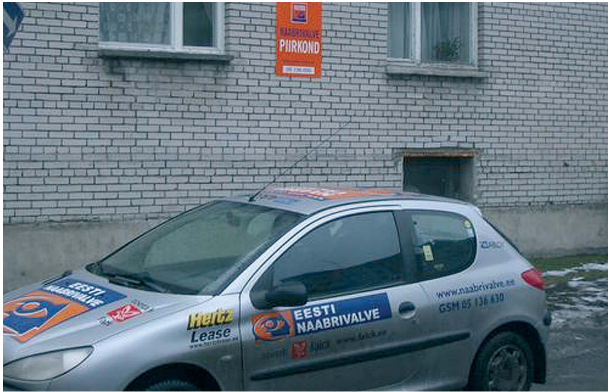
Naabrivalve piirkonnad tuleks kindlasti tähistada

jõudumööda. Koduperenaised võivad aeg-ajalt läbi akna või ukse silma visata pilgu trepikojas või hoovis toimuvale. Pensionärid, kes tihti veedavad aknaile pikki tunde, saavad seda teha nüüd naabruskonna huvides. Unetud aga hoiavad öösel ümbruskonnal silma peal. Isegi õues palli mängivad lapsed saavad jälgida koduhoovi, tänavat ja ümbruskonda. Kellel aga pole aega igapäevaseks jälgimiseks, võivad enda peale võtta majadevahelise koostöö koordineerimise ja vabal ajal patrullimise.