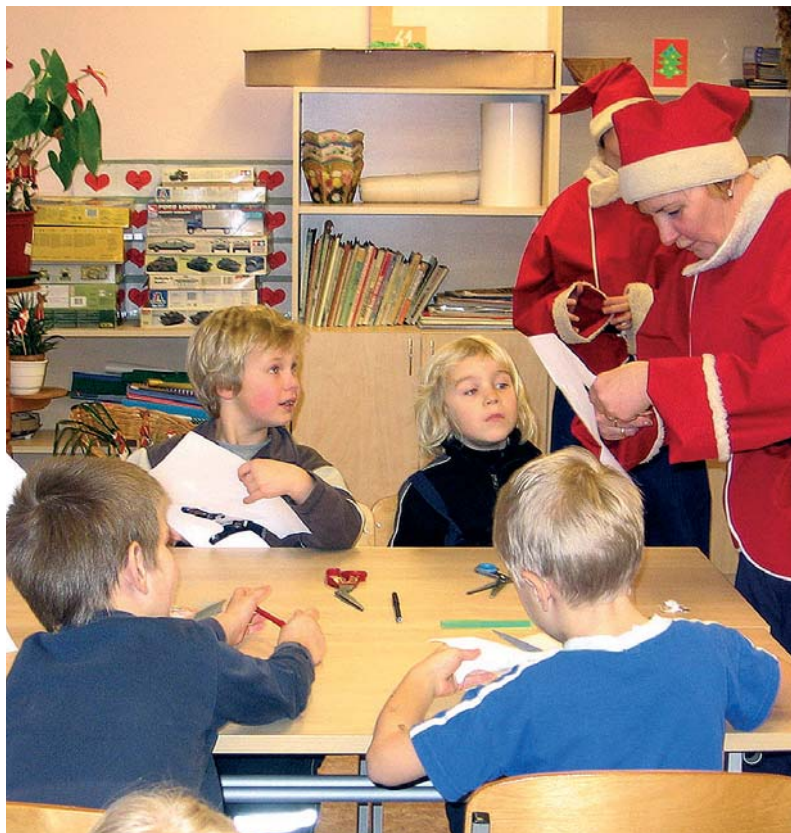
Käib töö ja vile koos

Päkapikula pere tervitab kõiki Jõelähtme valla elanikke