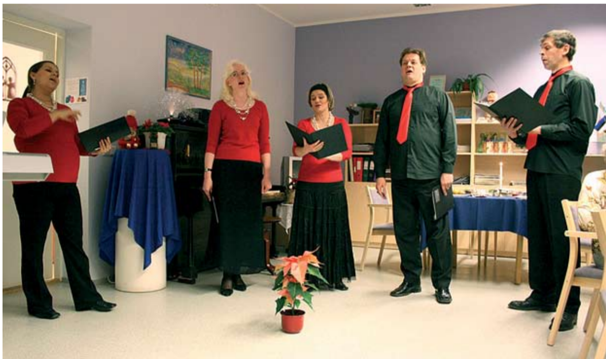
Vanu ja uusi jõululaule esitas ansambel "Amabile"