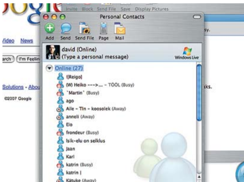
Messenger ja Google kuuluvad õpilase igapäevaste töövahendite hulka.

Miinused on, et unustatakse korrektn eesti keel ja kasutatakse palju