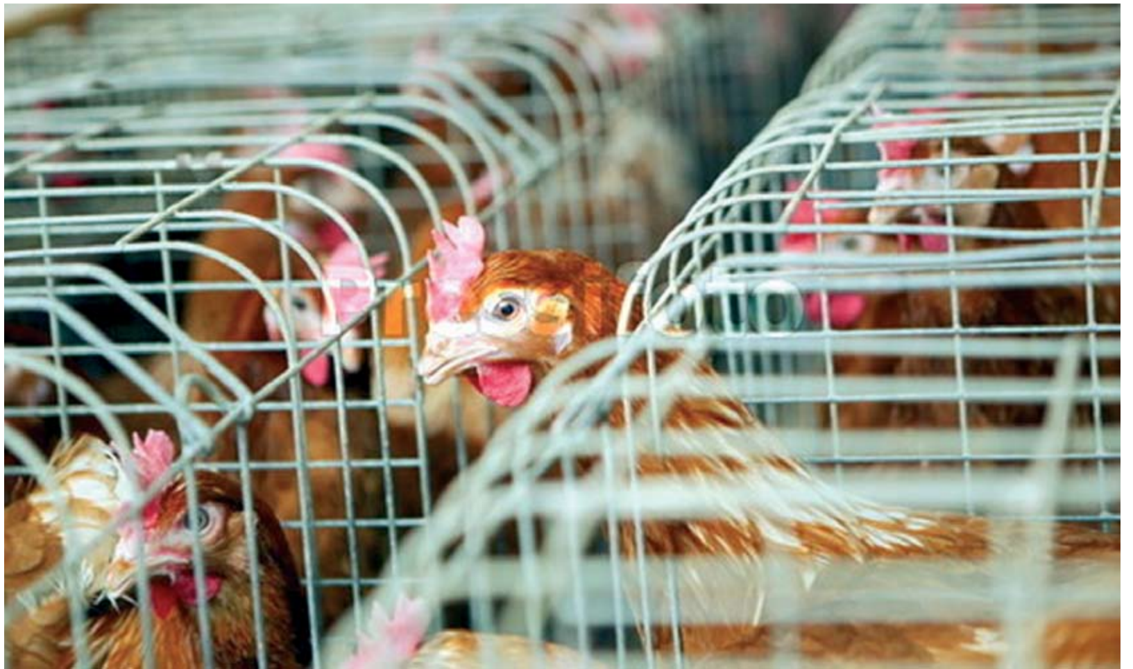
Kanad jäävad esialgu Jõelähtme valla registrisse

Hiljuti toimus Loo Kultuurikeskuses suurejooneliste ürituste programm "50 aastat kultuurielu Lool". Nagu paljudele selge, on need kaks tähtpäeva omavahel tihedalt seotud. Kunagise Loo aleviku südameks võis lugeda Linnuvabrikut või nagu tänapäeval öeldakse, oli ettevõtte ka kogu kohaliku elu peasponsoriks. Linnuvabrikus alustati 1956.a novembris munejate kanade kasvatust, broilerikasvatusega hakati tegelema aastaid hiljem. Edukuse üheks näitajaks oli tühjale kohale tekkinud Loo aleviku elanikkonna kiire kasv ja jõudsalt laienev tootmine. Linnuvabrik oli tuntud üle suure kodumaa ning õige pea omistati asutusele ka uus auväärne nimi: Tööpunalipu ordeni, Suure Oktoobrirevolutsiooni 60. aastapäeva nimeline Tallinna Näidislinnuvabrik.