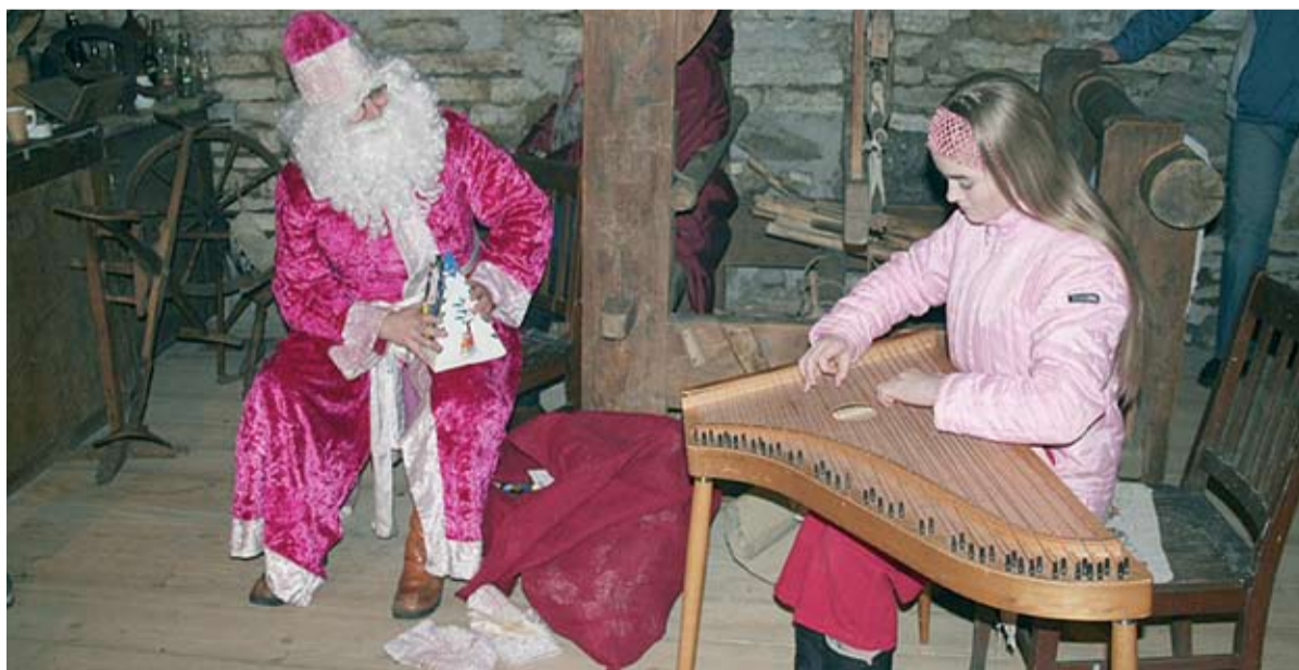
Jõuluvana külastas ka Rootsi-Kallavere küla

Küla jõulupeod pole uus nähtus. Neid on peetud juba mitu head aastat ja kahel viimasel korral on jõuluvana toonud pakke mitte ainult kõige pisematele, vaid ka soliidsemas eas külarahvale. Kui salmiitlemise aeg kätte jõudis, läks meeoleolu ärevaks.