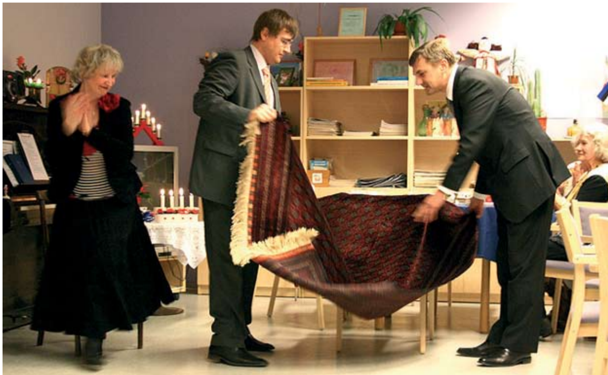
Valitsusjuhid kingitust avamas