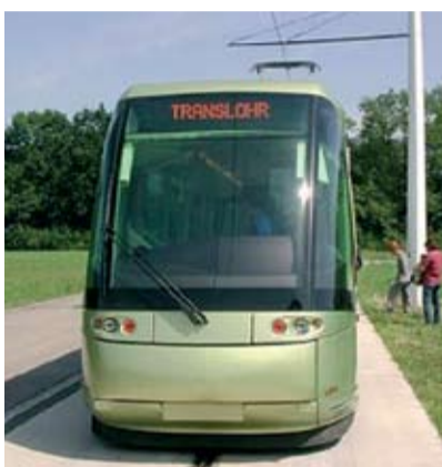
◀◀ Iru küla juurest möödub trammiliin