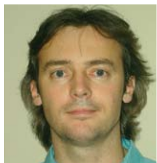
Art Kuum Volikogu liige IRL kandidaat

Keskkonnaprobleemidele otsime paralleelselt säästva suhtumisega tarbimise ja heitmetesse ka nüüdisaegseid tehnoloogilisi lahendusi ning edendame keskkonna- ja loodushariduse õpetamist. Terve Eesti on roheline Eesti!