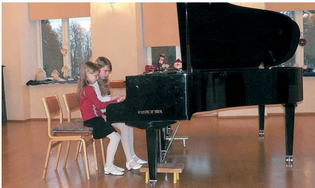
Esinemisvõimalus innustab ka tulevikus harjutama

Esitaks: Tohisoo on ilus koht – restaureeritud mõisahoonel ilusa talvise (sest festival on iga kord ju veebruarikuus!) looduse keskel on nagu loodud kauni muusika ja ka muidu positiivsete elamuste jaoks. Tähtmatult kerkib