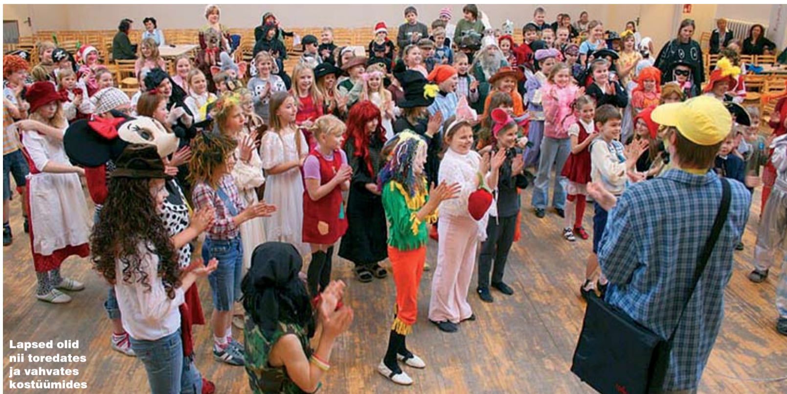
Lapsed olid nii toredate ja vahvates kostüümides

Pidu olid kutsutud läbi viima VILLI ja VOLLI, kes laulsid lastele ning korraldasid palju huvitavaid mänge. Peo juhid andsid järjekorras sõna kõigile koolidele. Esimesena astusid julgelt lavale Loo kooli 1. klasside õpilased, kes hoogsalt esinemisega kõigil kohe tuju heaks tegid. Kui ka Loo kooli 2. klasside õpilased endid tutvustanud olid, organiseerisid Villi ja Volli kõigile virgutava võistluse. Nii see pidu kulges, vaheldumisi laste vahvad etteasted ning Villi-Volli te-