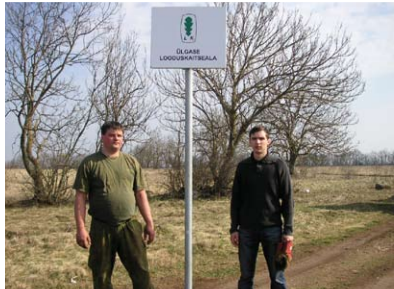
Ülgase looduskaitseala sai 17. aprillil territooriumi tähistavad märgid.

• Kaitsealal on lubatud rahvaürituste korraldamine, sealjuures on rohkem kui 15 osalejaga rahvaürituste korraldamine lubatud üksnes kaitseala valitseja nõusolekul.