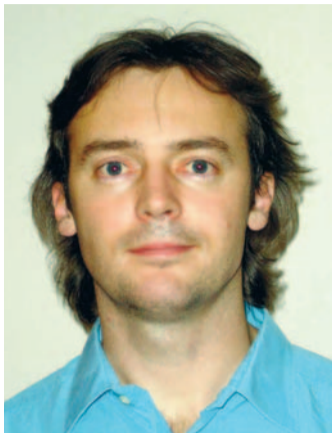
Art Kuum volikogu esimees

Volikogu esimehena oli mul väga hea meel näha, et vahel toovad just keerulised ja tähtsad ning rasked küsimused ühe mütsi alla kokku muidu nii kireva volikogu.