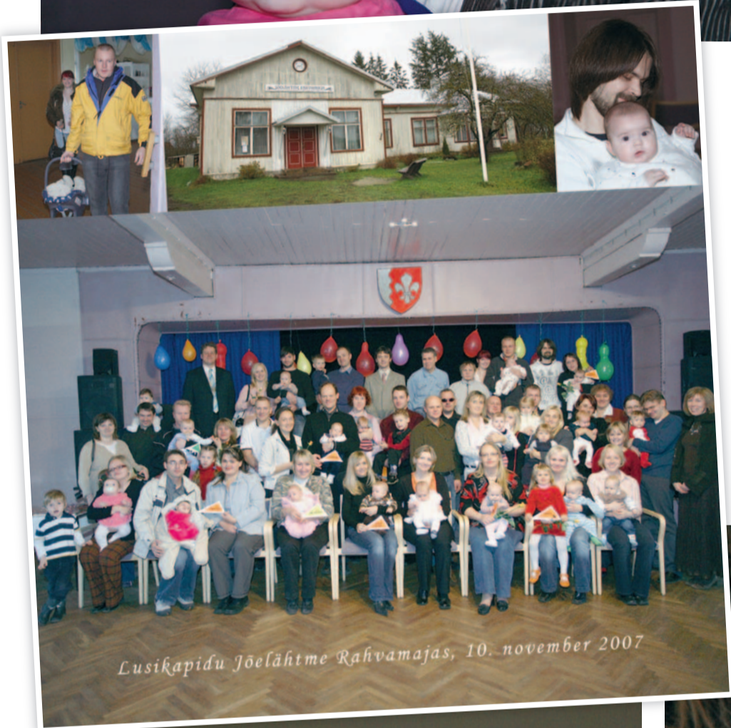
Lusikapidu Jõelähtme Rahvamajas, 10. november 2007