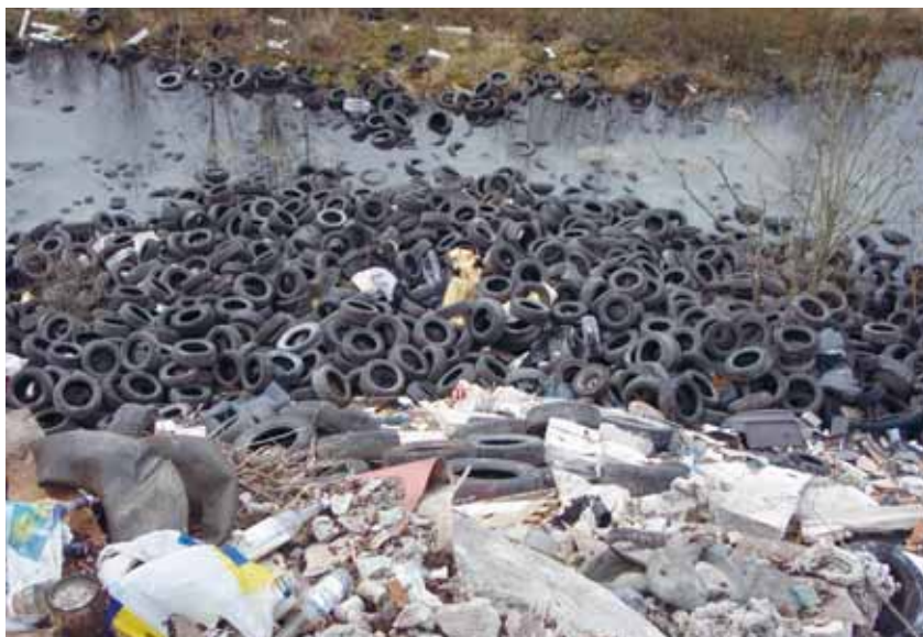
Vaade ühele autokummide kolooniale.