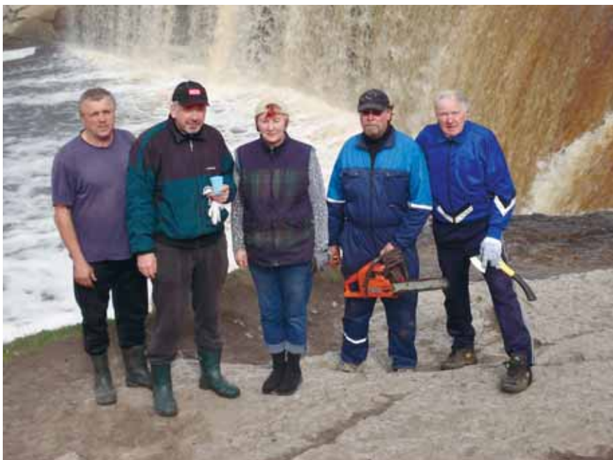
Vallavolikogu korrakaitsekomisjon laulupäeva peoplatsi korrastamise järel.