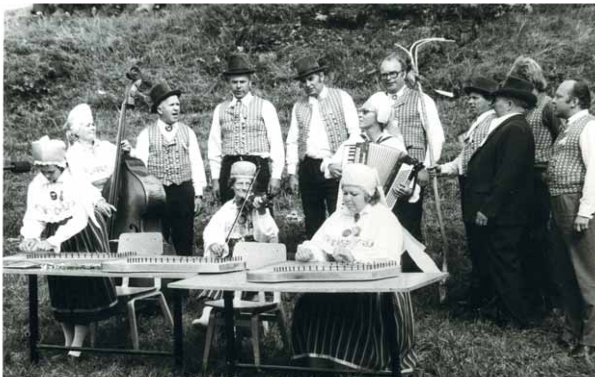
Ükskord pandi spontaanselt kokku lausa rahvapilliorkester.