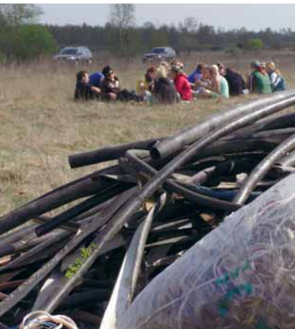
Linnarahva puhkepaus kaablikestade kuhja taga.