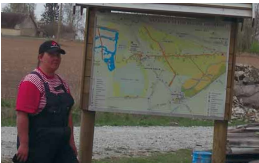
Külavanem on tehtuga rahul.