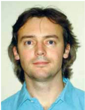
Art Kuum volikogu esimees

29-ndal aprillil toimunud vallavolikogu istungil olid lisaks detailplaneeringutele kavas ka mitmed põhimõttelistlaadi otsused. Kohe päevakorra alguses oli punkt: valla muudetud arengukava kinnitamine. Vaatamata sellele, et arengukava oli juba teisel lugemisel ning läbi käinud ka mitmest komisjonist, esitati istungi ajal veel täiendus- ja parandusettepanekuid ning hetkeks tundus, et arengukava tuleb veelkord vallavalitsusse tagasi saata ning uus ettepanekute tähtaeg seada. See oleks tähendanud arengukava kinnitamise lükkumist vähemalt kuu aja võrra edasi. Selle vältimiseks soovitasin volikogul kõik ettepanekud kohe läbi arutada ja arengukava vastavalt muuta ning lõpuks hääletusele panna. Nii ka läks, lõpuks sai arengukava kuni aastani 2015 vastu võetud.