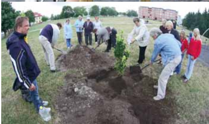
LOO MÄNGUVALJAKU AVAMINE