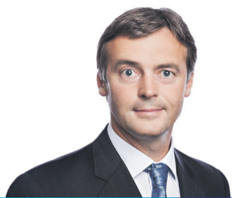
ART KUUM volikogu esimees, Dermaline OÜ, juhatuse liige 134