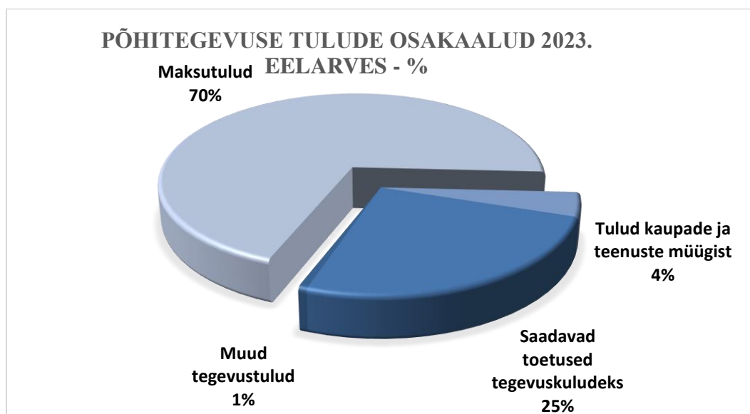
Joonis 1 Põhitegevuse tulude osakaalud 2023. aasta eelarves