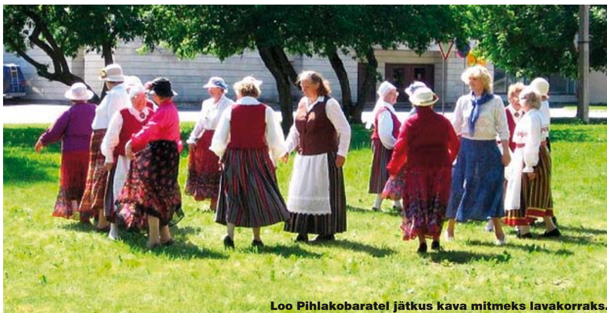
Loo Pihlakobaratel jätkus kava mitmeks lavakorraks.