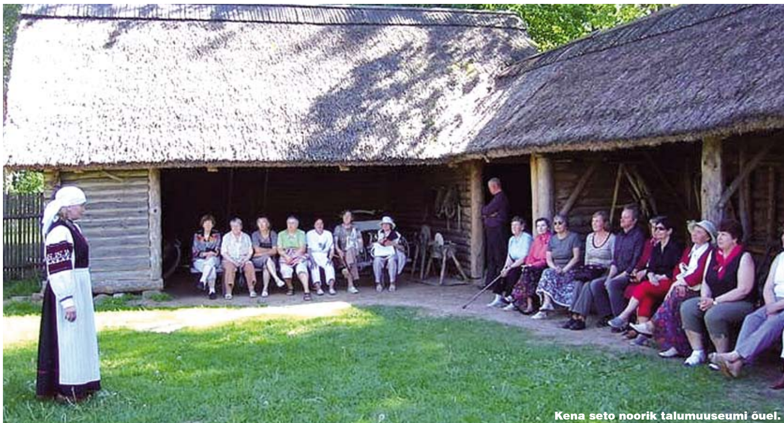
Kena seto noorik talumuuseumi õuel.

Järgmine peatus on Vöhandu jõe kaunil kaldal Rāpina. 500 aasta eest asus siin Repini küla, kus elas arvukalt poolakaid. Punase katuse ja tornikukega kiriku fassaadil seisavad tänini Poola-ajast pärit katoliiklusele omased jumalaema kujud. Rāpina mõis asutati XVI saj keskpaiku riigimõisana. 1858.a. sai valmis härrastemaja, kus vene ajal asus teada-tuntud Rāpina sovhoostehnikum. Praegu jagavad hoonet aiandusmuuseum ja Rāpina eakate klubi. Just selle klubi tantsurühmaga Pihlamarjad ongi meil kohtumine plaanitud. Ja juba jooksebki tantsurühma juhendaja