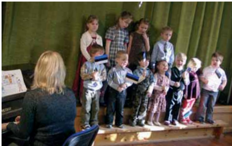
Neeme lapsed laulsid minister Juri Pihile.

Osavõtjad tuleb registreerida kirjalikult (täita ankeet) ja saata meili teel aadressile vilve@lookultuurikeskus.ee, hiljemalt 25. märtsiks 2008. a.