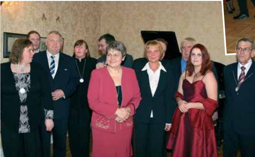
Jõelähtme valla külanemad.