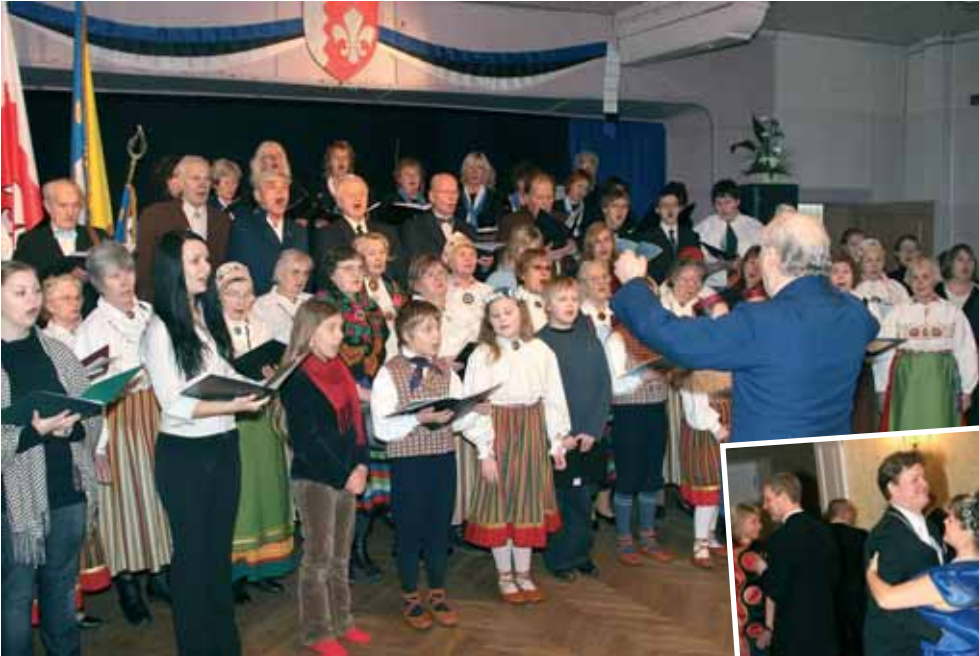
Laulupidu Jõelähtme rahvamajas.