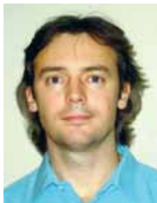
Art Kuum volikogu esimees

Veebruarikuu volikogu istungi päevakorras oli mitu elevust tekitanud punkti.