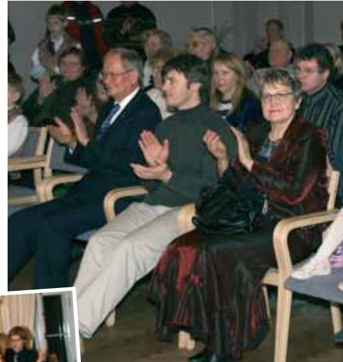
Europarlamenti saadik Tunne Kelam Jõelähtmes.