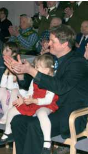
ähtme rahva hulgas.