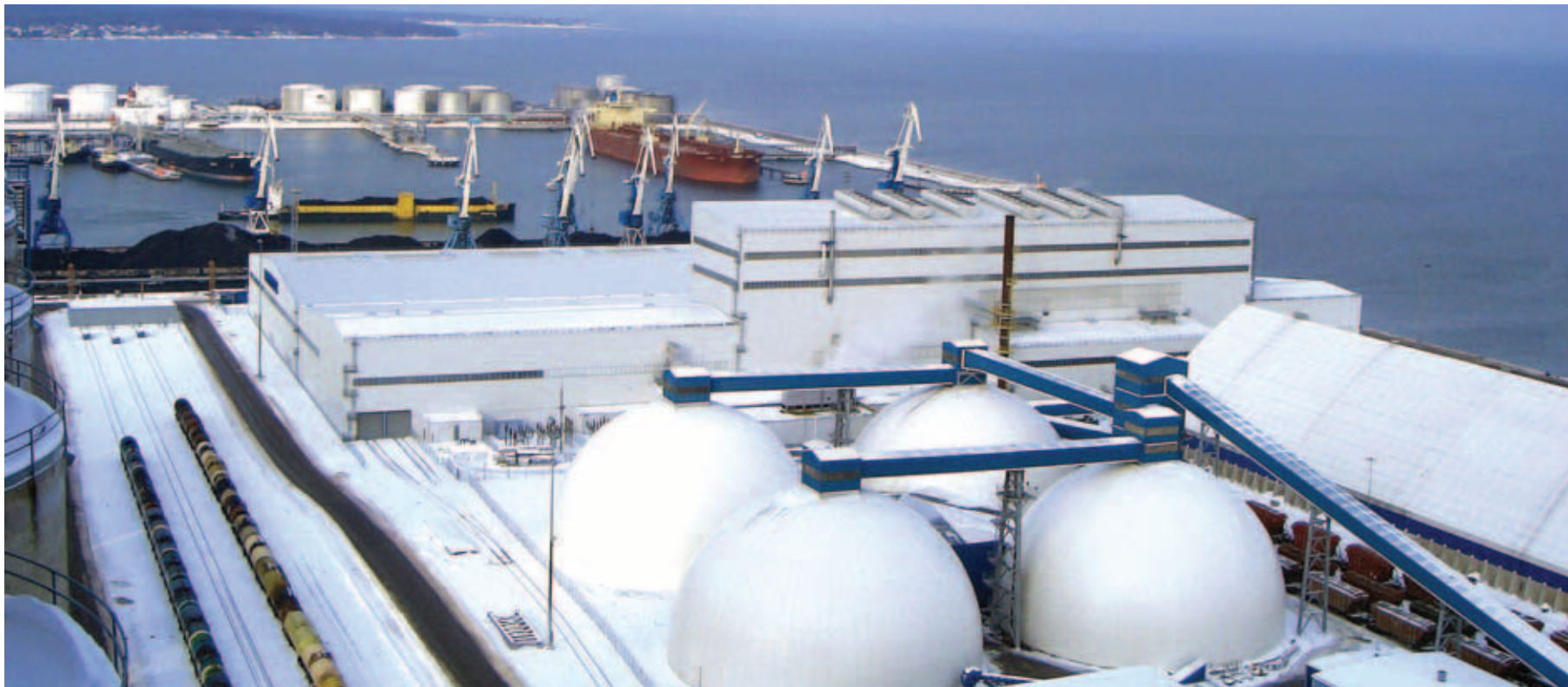
Talvine Muuga sadam

■ Millist ohtu kujutab Muuga sadam lähiumbruse küladele, mida annaks teha, et elukeskkond sadama naabruses loodus- ja inimsöbralikum saaks? Mida arvavad ümbruskonna elanikud sadamast?