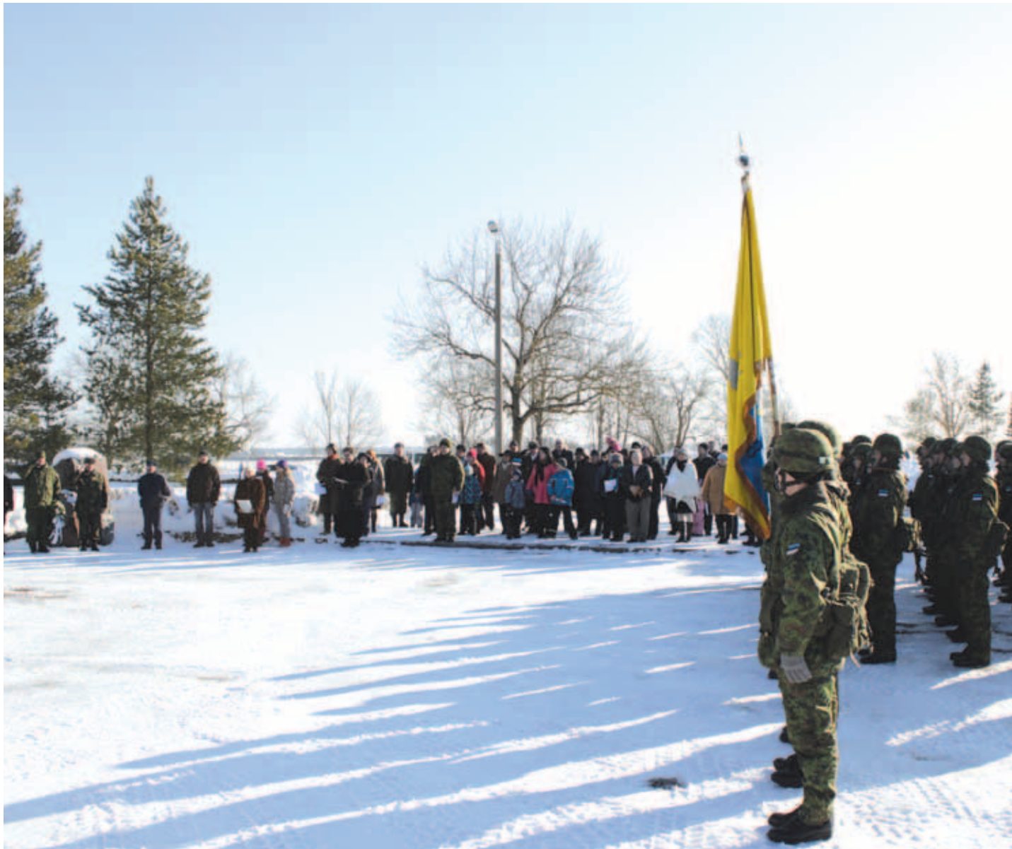
Jõelähtme vabadussamba juures toimunud pidulikult aktusel osales seekord ka 50 kaitseliitlast.