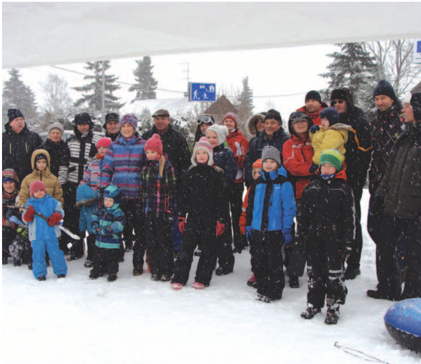
Hoolimata tuisusest ilmast olid vastlapäevalised rõõmsas tujuis.

Jätkugu seda isetegemise rõõmu siis meile kõigile ja head kodumaad sünnipäeval!