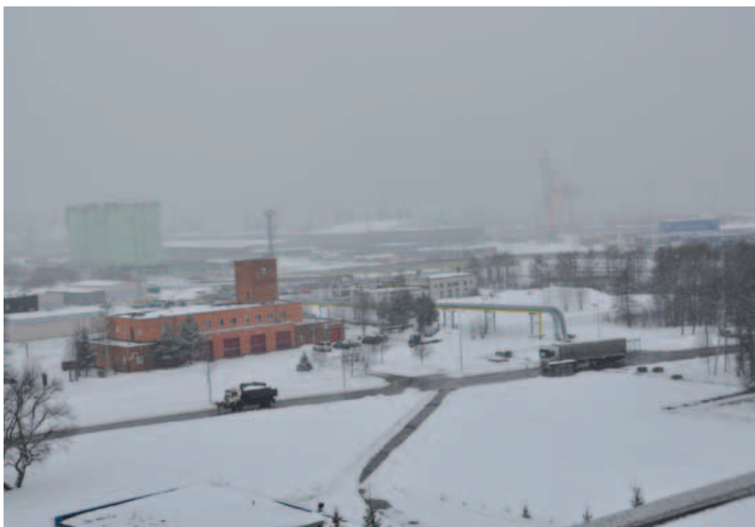
Vaade Muuga sadamahoone vaateplatvormilt talvisele sadamale.