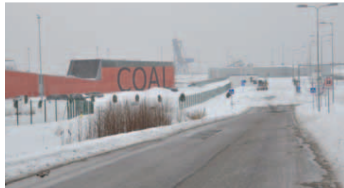
Pilk söeterminalile tõestab, et sadamajuhid kõnelevad söetransiidid kohta tõtt – terminali ümber ega sees söehunnikuid näha ei ole.

Läinud nädalal jõudis lõpule ka Muuga sadamasse juba 1997 aastal rajatud vabatsiooni laiendus. Vabatsioon laiendus just ida poole (Jõelähtme valla suunas) 227 hektarit, hõlmates nüüd maa-ala 464 hektaril. Vabatsiooni nõuetele vastava piirde kogupikkus on 12,7 kilomeetrit. Nüüdsest on peaaegu kogu Muuga sadama territoorium