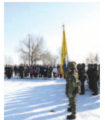
Eesti Vabariik 95