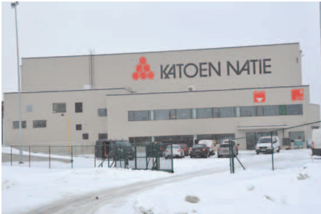
Hiljaaegu alustas sadamas tööd ka rahvusvahelisele kapitalile kuuluv terminal Katoen Natie, mis on spetsialiseerunud toiduainete ja plastiku transpordile.

konkond plaanib luua fondi, mida oleks na õnnetuse korral või siis hoopis üks olla, selles küsimuses võiksid ka n ka sadamapoolne idee korraldada ülaskäik sadamasse. Mida paremini aremad on tavaliselt omavahelised